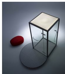
Showerbooth / 2011