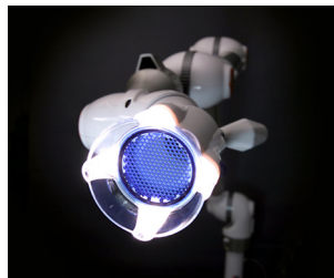
販売名：フリーアーム・アルテオ (医療機器認証番号：222AHBZX00018000号)