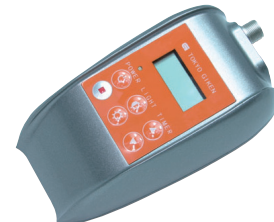
リモコン (プリリカ)