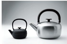
COOK KETTLE / 2008