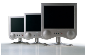
AQUOS G1 / 2001