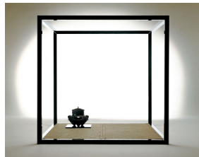
CEREMONY SPACE / 1986