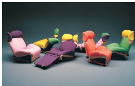
WINK / 1980 PHOTO Mario CARRIERI

1969年より、日本にとどまらず、環境および工業デザイナーとして、イタリアを始め、国際的に制作活動を拡げていく。ヨーロッパや日本のメーカーから、家具、液晶テレビなどの家電、ロボット、家庭日用品に至るまで、分野を超え、多くのヒット商品を生む。作品は、ニューヨーク近代美術館、パリ国立近代美術館、ミュンヘン近代美術館等、世界のミュージアムに多くコレクションされている。ライフワークとして、日本の伝統工芸に取り組む他、地場産業を活性化させる仕事に関わり続けている。