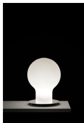
DENQ / 2011